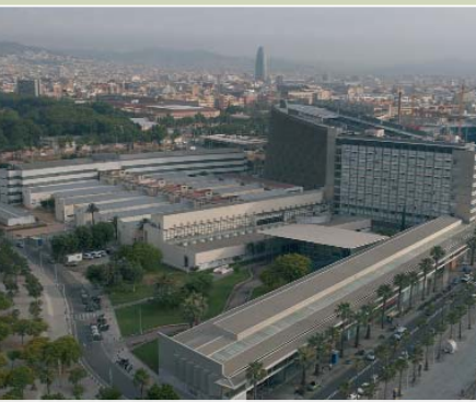
Estat actual i projecte de l'ampliació de l'Hospital del Mar

Tots aquests resultats s'han obtingut amb uns nivells d'eficiència que ens han fet mereixedors del reconeixement com a millor hospital de la nostra categoria en l'avaluació dels TOP 20. Una projecció que combina la nostra vocació de centres vinculats a la comunitat amb la necessària especialització i terciarització dels grans hospitals.