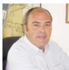
■ Programa de recerca en neuropsicofarmacologia Rafael de la Torre

Es consideren prioritaris els programes amb major projecció i relació amb la recerca a l'hospital. El programa d'epidemiologia i salut pública i el d'informàtica biomèdica hauran de desenvolupar-se en estreta col·laboració amb el CREAL i la UPF, respectivament, ja que ambdues institucions aporten importants recursos a aquestes mateixes àrees i el personal investigador treballa ja de forma integrada IB