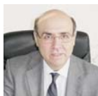
■ Programa de recerca en informàtica biomèdica Ferran Sanz