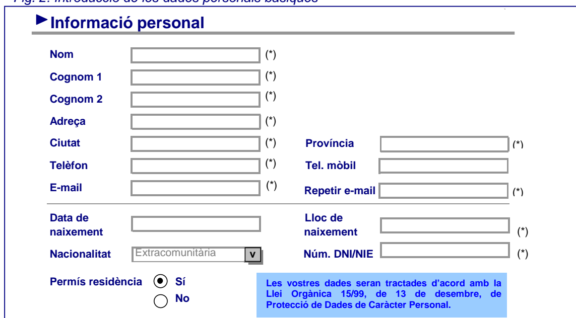
Fig. 2: Introducció de les dades personals bàsiques

El formulari d'informació personal, tal com el seu nom indica, és el formulari on es recullen les teves dades personals, amb la finalitat que puguem conèixer qui ets, com podem posar-nos en contacte amb tu i quan pots treballar, mitjançant una sèrie de campus que cal omplir de manera obligatòria , els quals apareixen marcats amb un asterisc (*). En el supòsit que hagis oblidat d'entrar les dades corresponents a algun camp obligatori, el propi sistema t'ho comunicarà, tot permetent-te tornar enrera per tal de corregir qualsevol possible manca de dades.